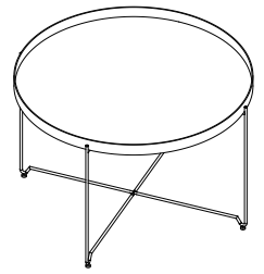
TABLE D'APPOINT SÉVILLE