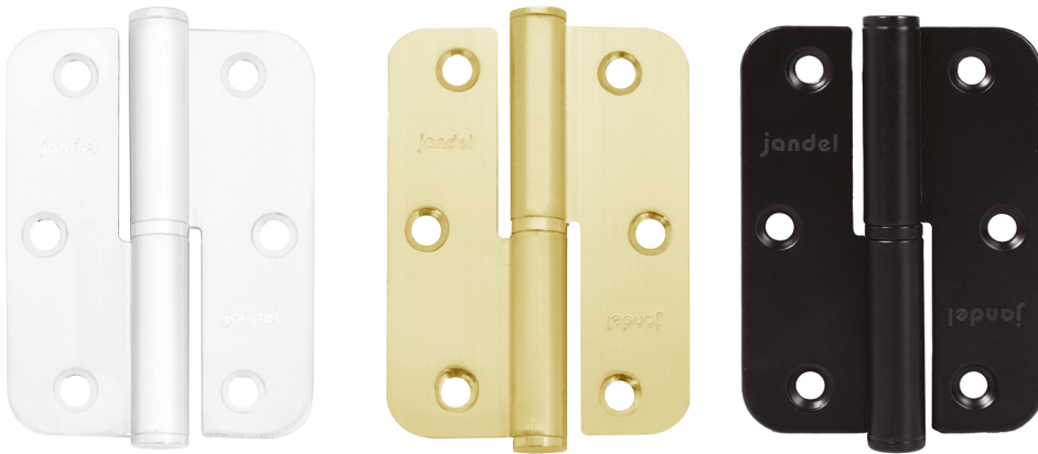
90/65 Pernio de acero Steel hinge