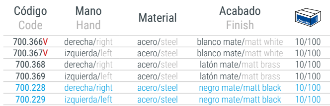
MODELO 305/100 Pernio de acero Steel hinge