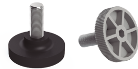
Nivelador M-10 incluido